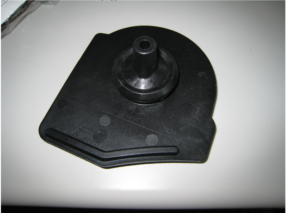
1 x 8P0 802 846 8,45€ (Rabattgruppe 8) – Aufnahme vorn rechts